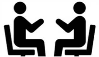
上司と部下による週1回～隔週程度の定期的な1対1の対話。

シリコンバレーが発祥の地とされ、日本ではヤフージャパンが成果をあげ、注目を集める1on1ミーティング。現在、企業規模や業種を問わず、数多くの企業で導入が進んでいます。しかし、形だけをまねて導入し、本来の効果を引き出せていない企業も多いようです。本ワークショップでは、1on1本来のゴールである経営と社員のエンゲージメント（絆）をつくる本質的な1on1を実践できるようになるための経営者、リーダー向けのワークショップです。