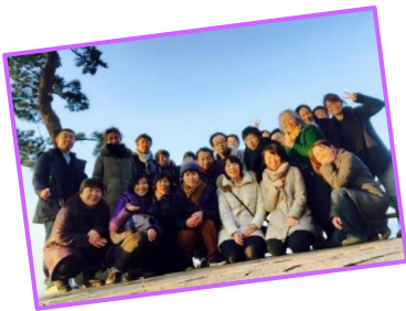
↑ 2016年参加者の皆さま

そんな問いを持ちながら今を生きている人・本気でかけがいのない 自分の人生を生きたいと思う人に最適のワークショップです。